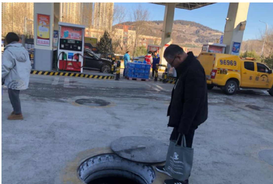
中国石油天然气股份有限公司山东济南销售分公司旅游路港沟加油站现场照片