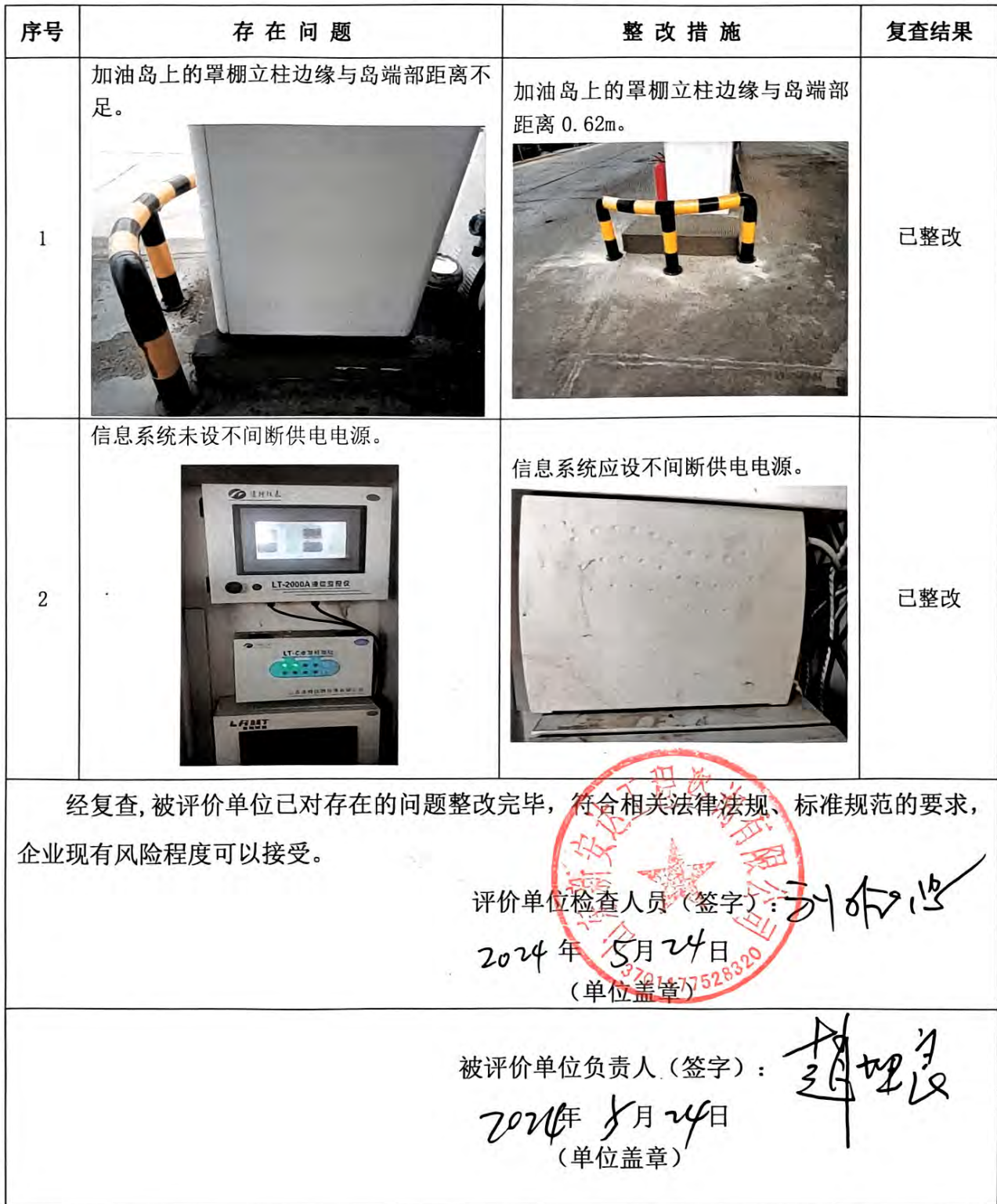
表 8-1 整改情况复查表