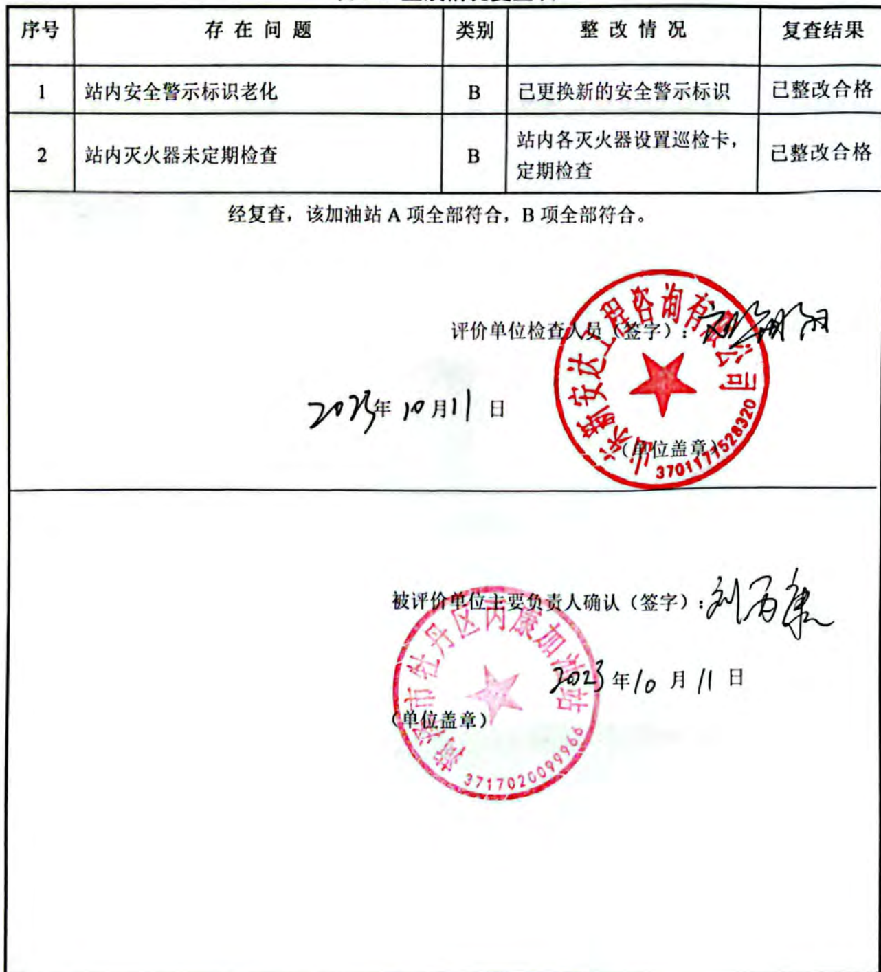
表 8-1 整改情况复查表