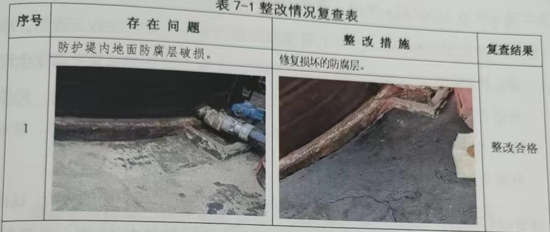
表 7-1 整改情况复查表